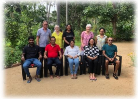
Vorstandsmitglieder und Team Kurunegala

Nach einem kurzen diesbezüglichen Stimmungsbild bei unserem Jahrestreffen 2024 haben wir im Vorstand beschlossen, keine neuen Patenschaften mehr aufzunehmen, sondern nur noch die bisherigen im oben genannten Sinne weiterzuführen. Wir versprechen uns davon eine etwas grössere «Verteilungsgerechtigkeit», weil wir über die Unterstützung von Schulen und Kindergärten mehr Kinder erreichen und weniger «auswählen» müssen. Unser Team in Kurunegala hat im Januar ein Treffen der Patenkinder mit den Vorstandsmitgliedern aus Schaffhausen organisiert. Das ist ihnen sehr gut gelungen!