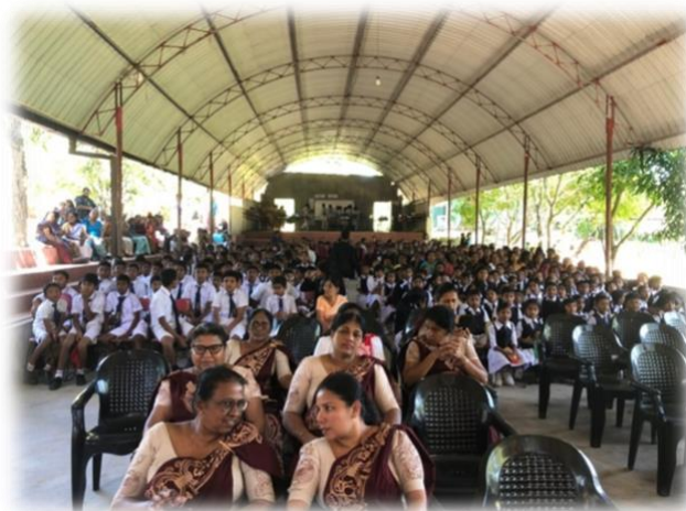
Die volle Aula für den Anlass im Januar.

Im letzten Jahr wurde Englisch-und Mathematik-Unterricht bezahlt. Die grosse Aula ist mit unserer Unterstützung saniert worden: Fussboden, Treppe, Regenrinnen...Jetzt ist sie auch während der Regenzeit benutzbar und bot genügend Platz für den gross angelegten Empfang der Schaffhauser Besucherinnen.